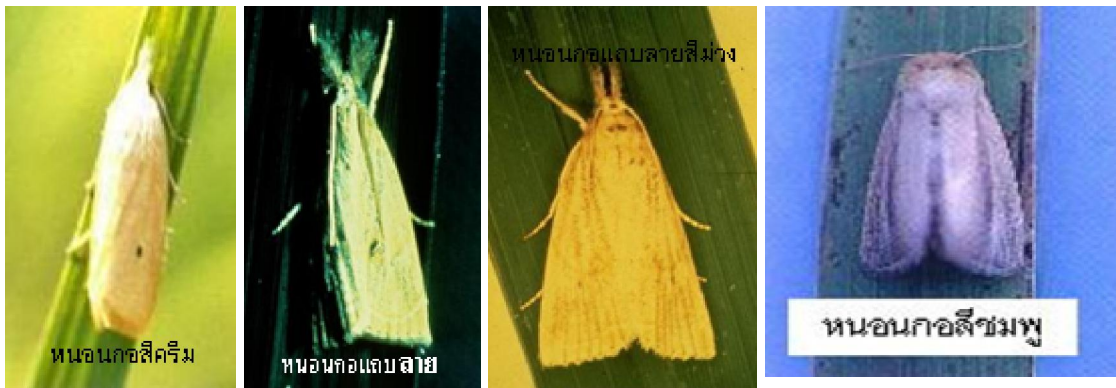
หนอนกอข้าวสี ครีม