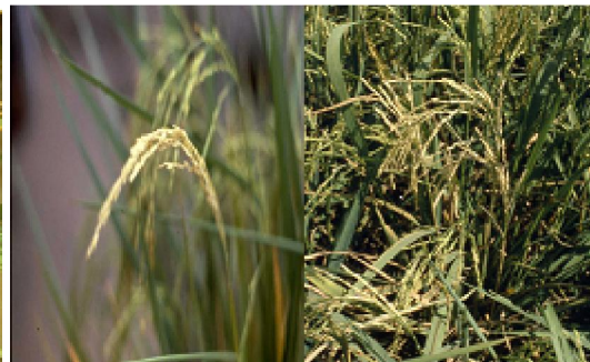
ข้าวหัวหงอก