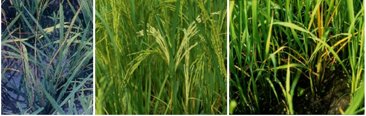
ลักษณะการทำลาย ของหนอนกอในข้าว ระยะแตกกอทำให้ยอดเหี่ยว ระยะออกรวงทำให้รวงข้าวสี ขาวเมล็ดลีบ