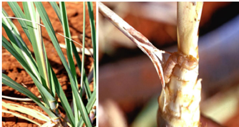
การทำลายในอ้อย หนอนเจาะอ้อยระดับคอดิน กัดกินอยู่ ภายในต้นอ้อย ทำให้ยอดอ้อยแห้งตาย

หนอนกอข้าวเป็นแมลงศัตรูข้าวที่พบเป็นประจำในนาข้าว แต่มักจะไม่ทำความเสียหายข้าวสืบ ทั้งรวง รวงข้าวมีสีขาวเรียกอการนี้ว่ารุนแรงเช่นเพลี้ยกระโดดสีน้ำตาล พบปริมาณมากในฤดูนาปรัง การทำลายจึงสูงกว่าฤดูนาปี ฝี่เสื่อหนอนกอข้าวจะเคลื่อนย้ายเข้าสู่แปลงนาเมื่อข้าวอายุระหว่าง 30- 50 วัน การระบาดมากขึ้นกับสภาพแวดล้อมและฤดูการทำนาของสถานที่นั้นๆ สามารถเพิ่ม ปริมาณได้ 2-3 อายุขัยต่อฤดูปลูก